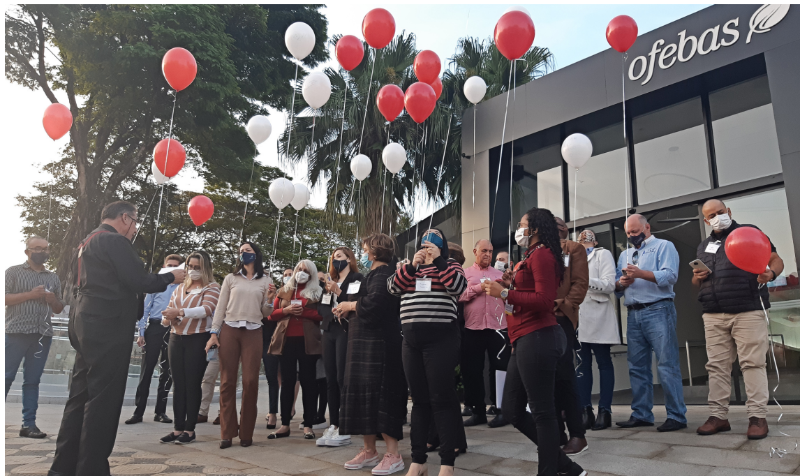
A soltura de balões é uma das formas de homenagear a história de vida de alguém. Esse ato marcou o último dia do curso. Participantes foram convidados a escrever uma mensagem de carinho a um ente querido