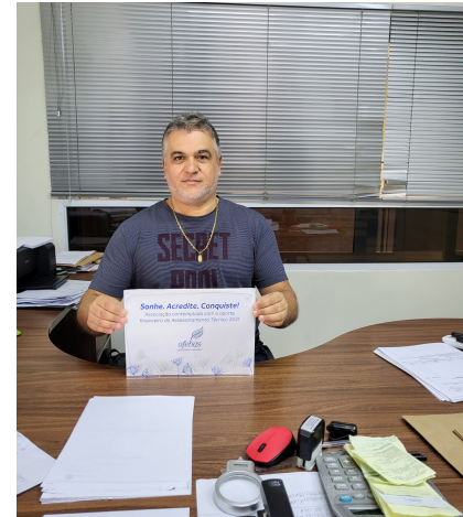
Associação dos Deficientes de Votorantim