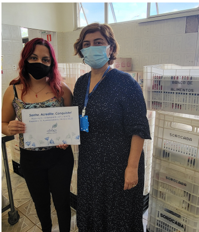
Banco de Alimentos de Sorocaba