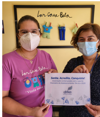
Lar Casa Bela