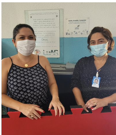
Associação Lugar de Amor e Restauração