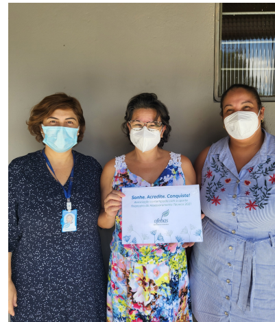
Associação Educacional e Beneficente Vale da Benção