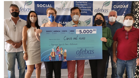
18-Contemplação com o aporte financeiro / Assessoramento Técnico 2021