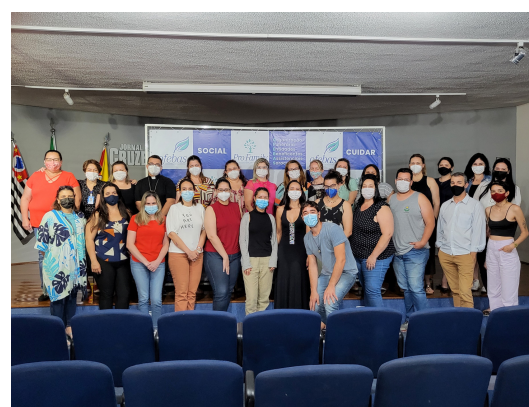
8-Nosso Assessoramento Técnico 2021 voltado às instituições de Sorocaba e Votorantim