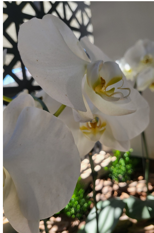
15-Inúmeras famílias acolhidas no momento mais delicado da vida