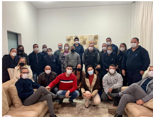
5-Muitos treinamentos de equipe!