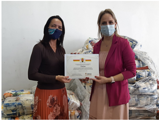
1-Doação mensal de 30 cestas básicas para o Fundo Social de Solidariedade durante o ano