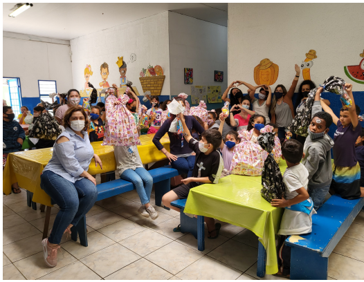
9-Evento de Dia das Crianças na LuAR