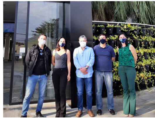
6-Visitas técnicas e participações em Congressos