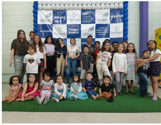
10-Evento de Dia das Crianças / colaboradores