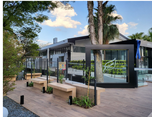
13-Inauguração da Praça Luz