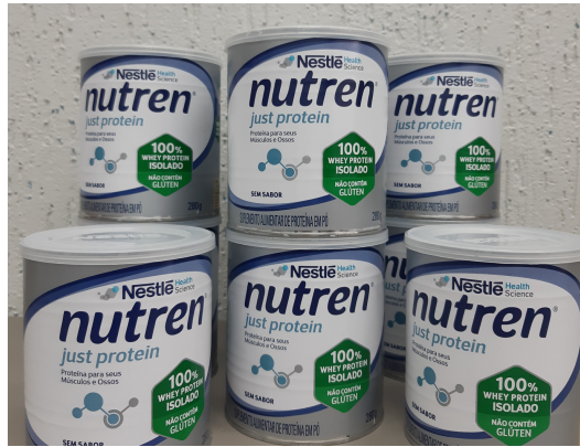
2-Desde dezembro de 2020, fazemos a doação mensal de 10 unidades de suplementos para dois irmãos, de 25 e 13 anos de idade, diagnosticados com Distrofia Muscular de Cinturas (DMC) que pertencem à família socialmente vulnerável