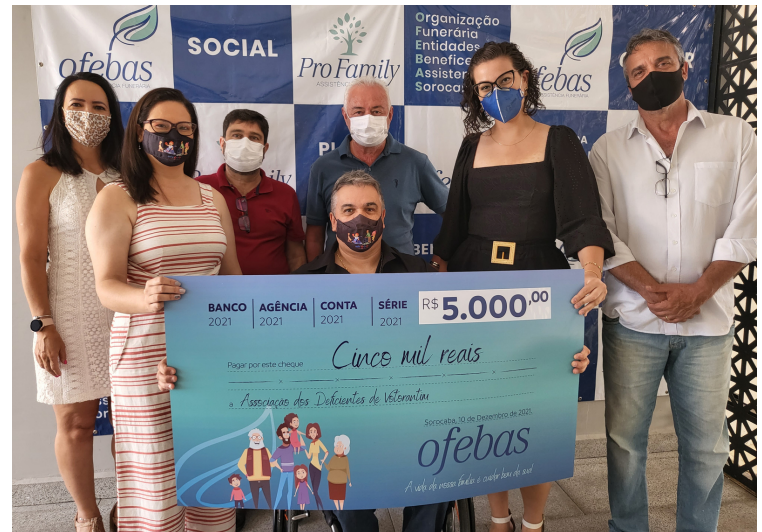
Associação dos Deficientes de Votorantim

Por sua vez, a Associação dos Deficientes de Votorantim propõe arquitetar uma sala com recursos materiais para trabalhar a estimulação precoce de crianças de 0 a 3 anos que apresentam diagnóstico ou prognóstico no atraso do desenvolvimento neuropsicomotor ou síndrome genética. Esses materiais são dos mais simples aos mais complexos, estimulando as habilidades visuais, auditivas, comunicativas e motoras.