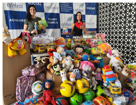
7-Diversas campanhas, ações internas e doações realizadas para instituições sociais e famílias em vulnerabilidade social