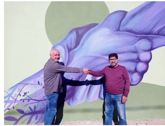
11-Concurso Foto no Muro