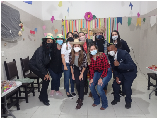
4-Nossa festa Julina