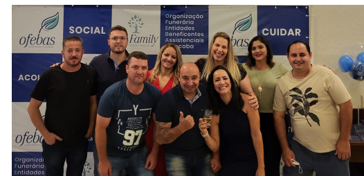
17-Confraternização de fim de ano