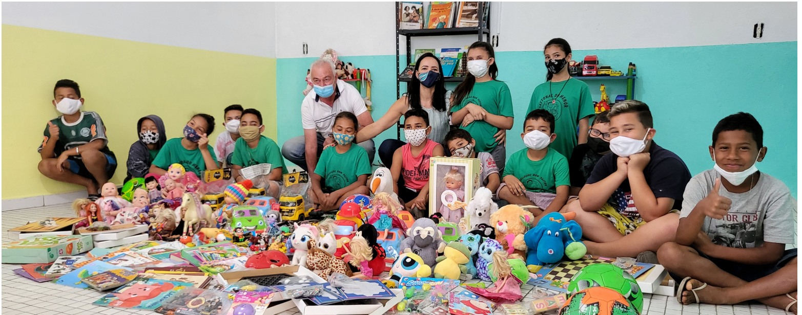
Além dos brinquedos e livros, a Pastoral do Menor também recebeu uma pequena reforma na sala da brinquedoteca e na de TV

A campanha interna de arrecadação de brinquedos e livros, realizada em outubro, foi tão generosa que conseguimos montar duas brinquedotecas! A primeira instituição que recebeu as doações foi a Pastoral do Menor CEC Ipiranga, que atende em contraturno escolar 51 crianças de 07 a 12 anos socialmente vulneráveis. Além dos brinquedos e livros, também foi realizada uma pequena reforma na sala da brinquedoteca e na de TV.