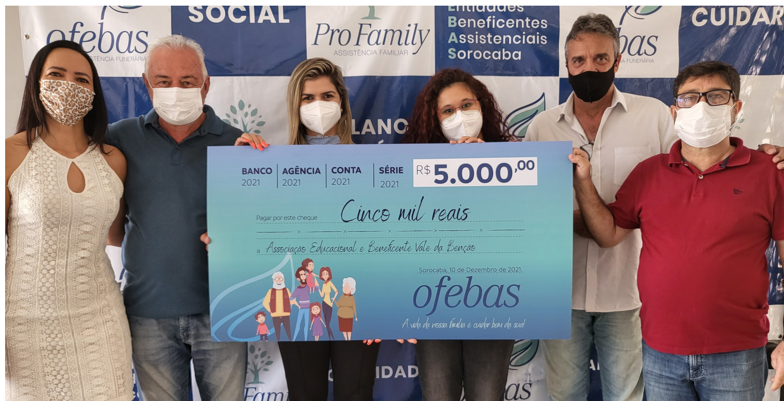
Associação Educacional e Beneficente Vale da Benção recebendo o aporte financeiro

Aporte financeiro do Assessoramento Técnico tem como objetivo contribuir para as entidades implantarem ou aprimorarem um projeto social que corresponda às necessidades de seus atendidos