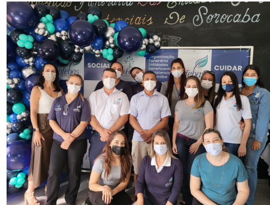
14-Nosso aniversário de 55 anos