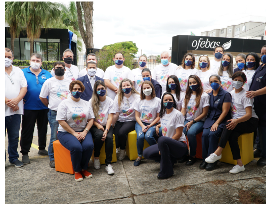
12-Evento de Finados em homenagem às vítimas de Covid-19