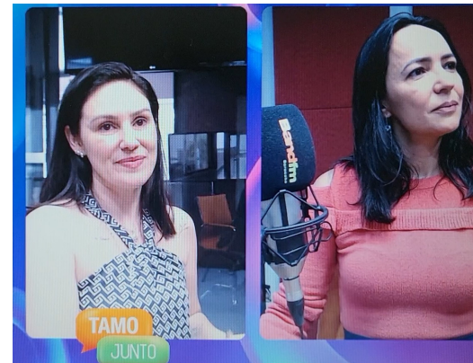
16-Várias entrevistas e matérias na imprensa