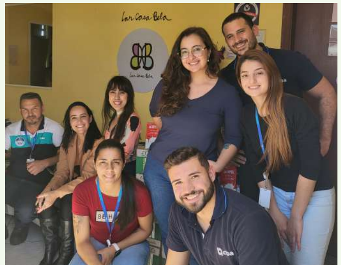
Profissionais da CBA durante entrega das doações de leite

Em agosto e setembro, nós estamos com a Campanha de Arrecadação de Leite para ajudar um lar infantil! Apenas no primeiro mês de ação, nós já conseguimos 149 litros de leite! E no dia 01/09 fizemos o primeiro direcionamento: as doações foram recebidas pela instituição Lar Casa Bela. Nós decidimos unir forças com uma equipe de jovens profissionais da CBA que também direcionaram muitos mantimentos para a entidade! Afinal, juntos somos bem mais fortes!