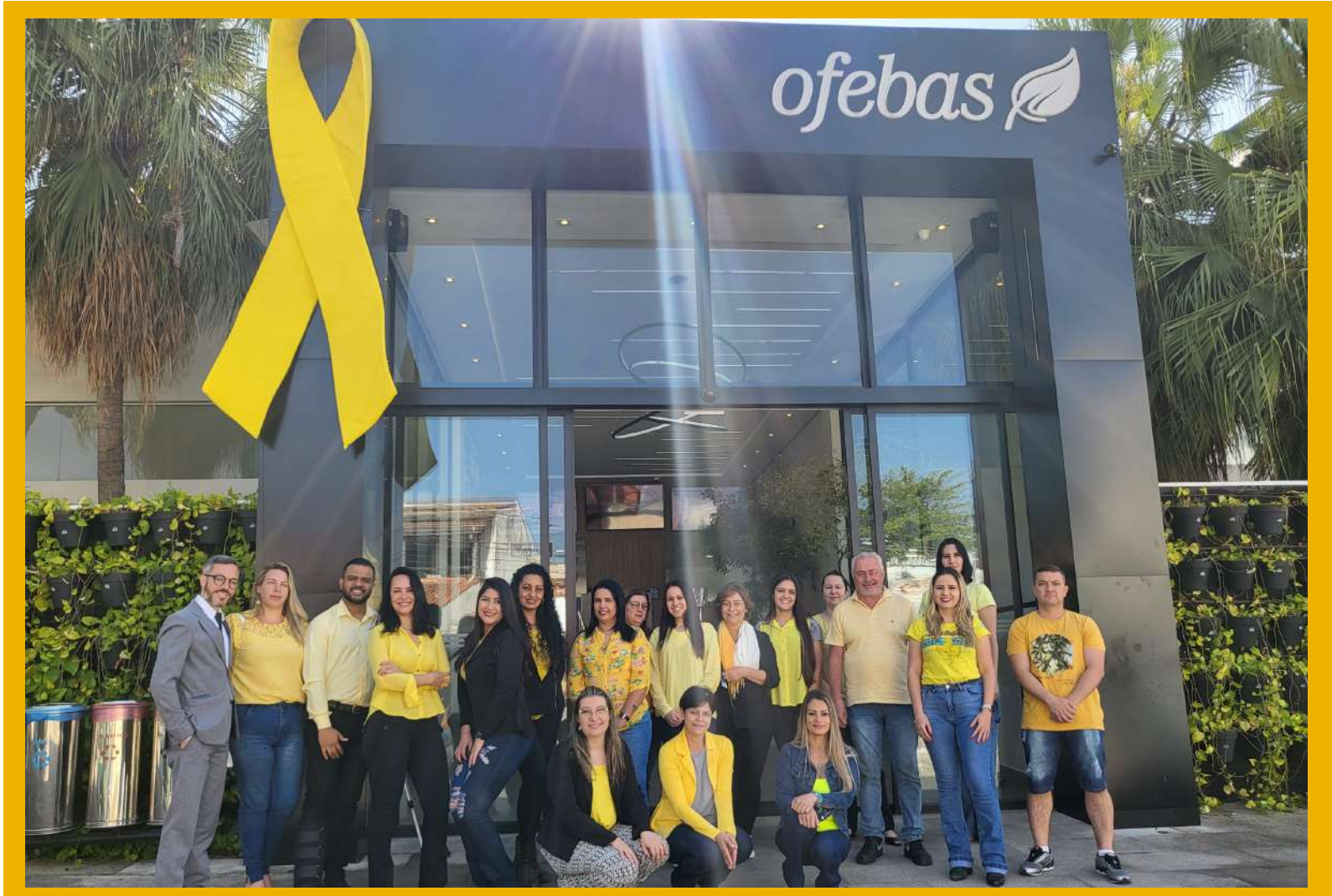
Alguns colaboradores da Ofebas em adesão à campanha de Setembro Amarelo

Durante todo o mês acontece a campanha Setembro Amarelo em prevenção ao suicídio. E, como a Ofebas é uma organização que preza pelo acolhimento e cuidado, nossos colaboradores aderiram a essa campanha!