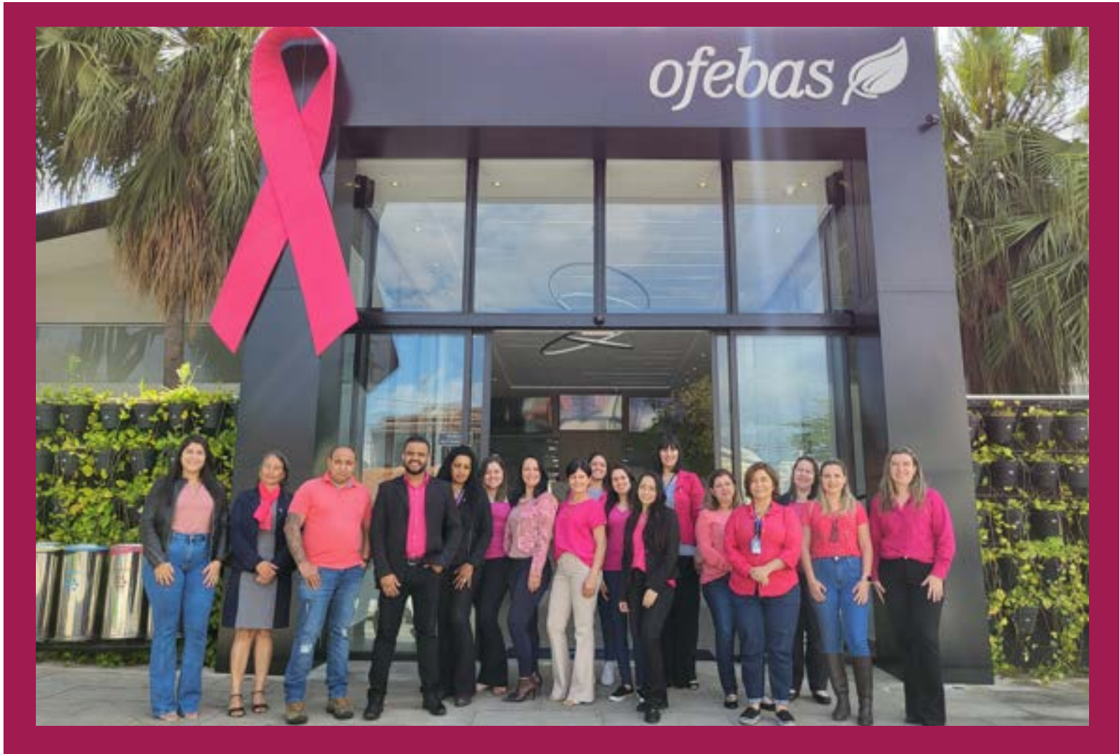
Alguns colaboradores da Ofebas em adesão à campanha Outubro Rosa