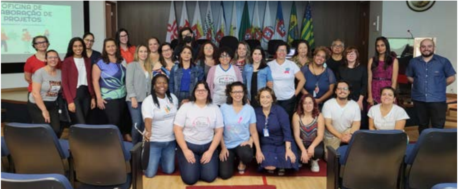
Capacitação teve início no mês de agosto de 2022

O Assessoramento Técnico, capacitação gratuita oferecida às instituições sociais de Sorocaba e Votorantim, já está caminhando para a reta final. Faltam apenas dois encontros. O treinamento se encerra em 27/10.