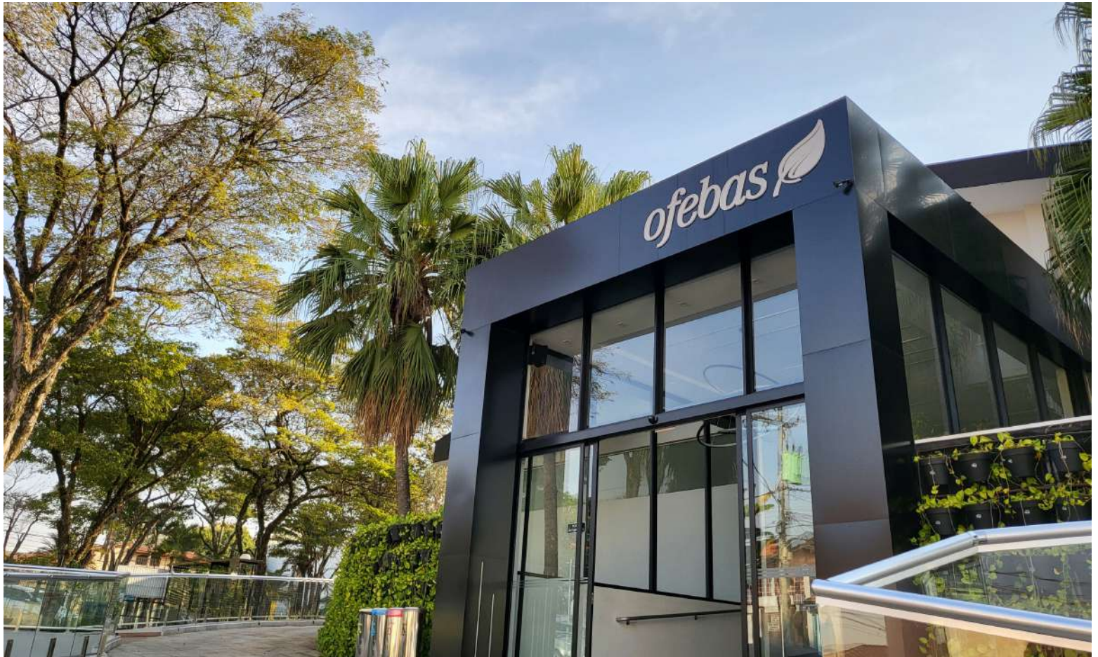
Fachada da unidade de Sorocaba

Em mais de cinco décadas, a organização se diferencia pelas ações e projetos que desenvolve, que beneficiam tanto famílias socialmente vulneráveis quanto instituições sociais