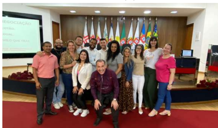
Turma do dia 17/11/22