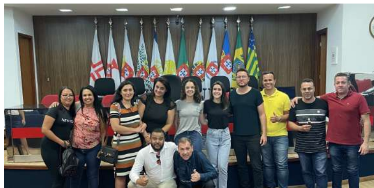
Turma do dia 16/11/22

plo, é uma forma da pessoa que era vaidosa continuar sendo pois, durante a preparação do corpo, os tanatopraxistas vão tomar todos os cuidados necessários para que o corpo seja apresentado de forma digna. Afinal, essa será a última imagem que ficará na memória”.