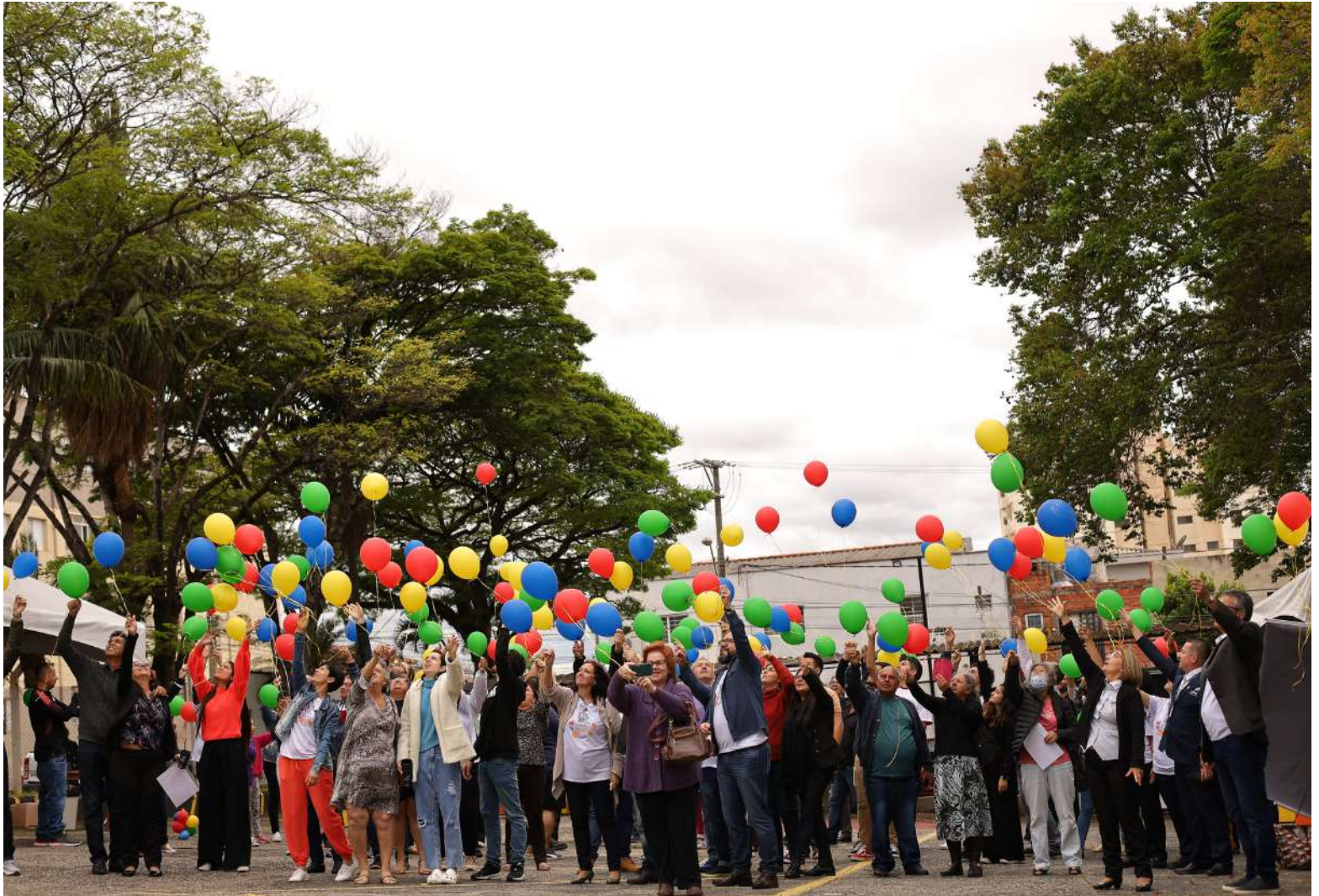
A soltura de balões coloriu o céu no encerramento da ação

Caricaturas, fotografias, música ao vivo e soltura de balões ecológicos marcaram as homenagens de Finados deste ano