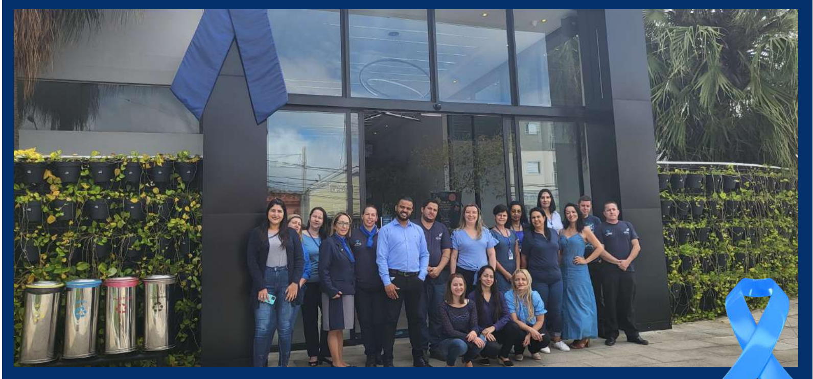
Alguns colaboradores da Ofebas em adesão à campanha de Novembro Azul

Você sabia que o câncer de próstata é muito comum entre os homens? Ele atinge cerca de 62% desse público com mais de 50 anos.