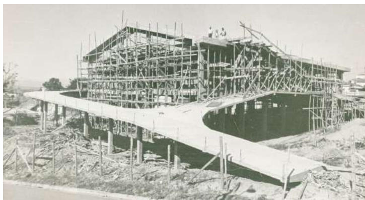
Construção da unidade de Sorocaba em 1979