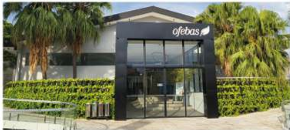
Fachada Ofebas, Unidade Sorocaba

O investimento social da Organização Funerária das Entidades Beneficentes e Assistenciais de Sorocaba (OFEBAS), nos municípios de Sorocaba e Votorantim, cresceu em mais de 30% entre os anos de 2020 e 2022. Por ser sem fins lucrativos, toda renda gerada é investida em ações sociais e na própria estrutura da funerária para o acolhimento de famílias enlutadas e/ou em algum tipo de vulnerabilidade.