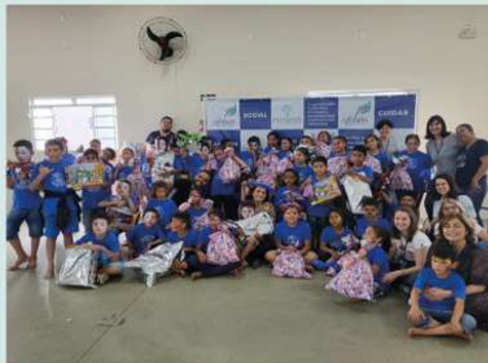
Dia das Crianças Pastoral do Menor - CEC Jacutinga

“Expresso meus sinceros agradecimentos a Ofebas por tanto carinho e cuidado dedicados as nossas crianças. A festa do Dia das Crianças é um