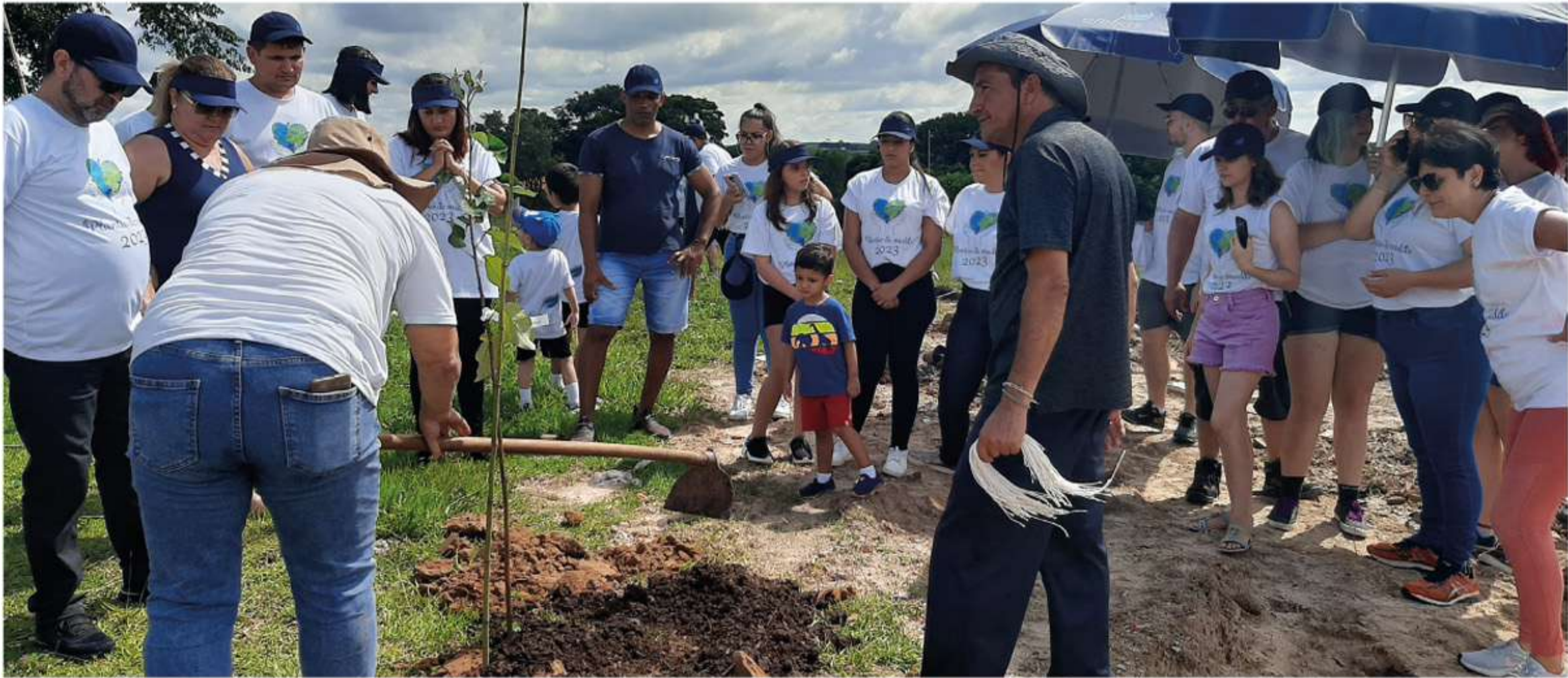
Equipe da SEMA orienta sobre o plantio de mudas

Com o objetivo de promover a arborização urbana e ajudar na recuperação de nascentes e de refúgios da biodiversidade, a Ofebas e a Prefeitura, por meio da Secretaria de Meio Ambiente, Proteção e Bem-Estar Animal, plantaram 155 árvores nativas e frutíferas no Jardim Santa Madre Paulina, região da zona norte da cidade. A ação aconteceu no dia 25 de fevereiro.