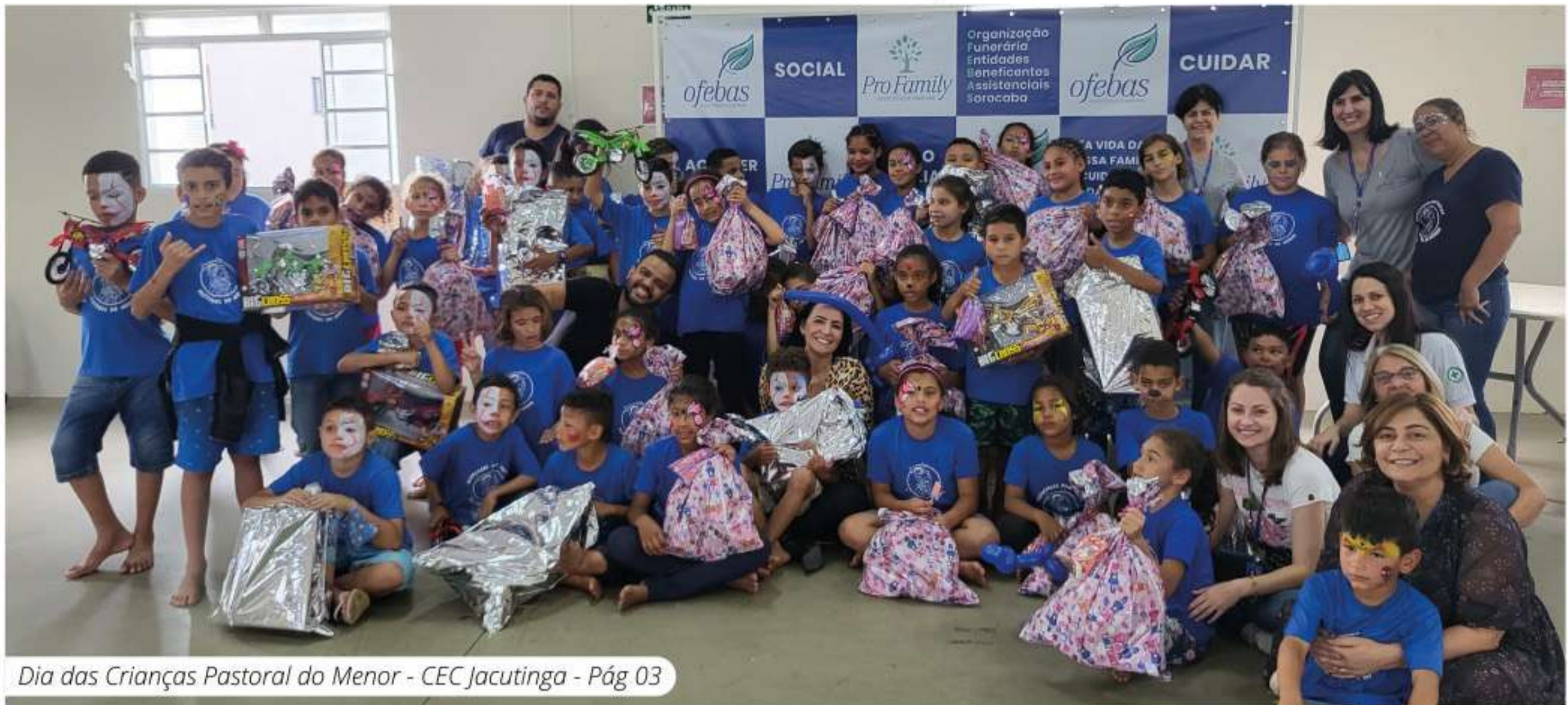
Dia das Crianças Pastoral do Menor - CEC Jacutinga - Pág 03

Ofebas e Prefeitura plantam mais de 150 mudas de árvores na zona norte de Sorocaba