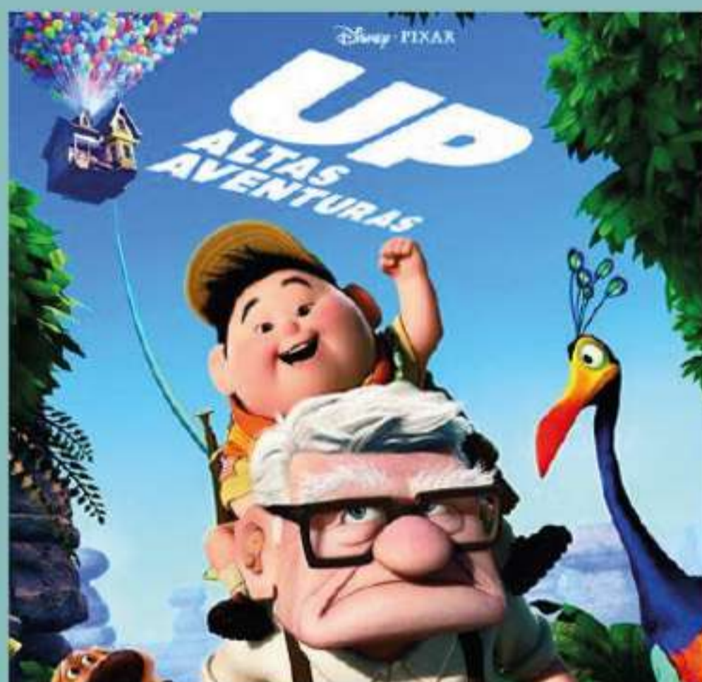
UP Altas Aventuras

Conta a história de Howard, um jovem empresário e publicitário, dono da sua própria agência de publicidade junto com mais três amigos. Após a perda de sua única filha, Howard se encontra em estado de tristeza profunda, ficando isolado do trabalho e dos amigos. Com o passar do tempo, ele começa a escrever cartas para o amor, o tempo e a morte. Mas o impossível acontece quando essas três forças decidem responder, mostrando a ele o valor e a beleza da vida mesmo após a perda de um ente tão próximo e querido.