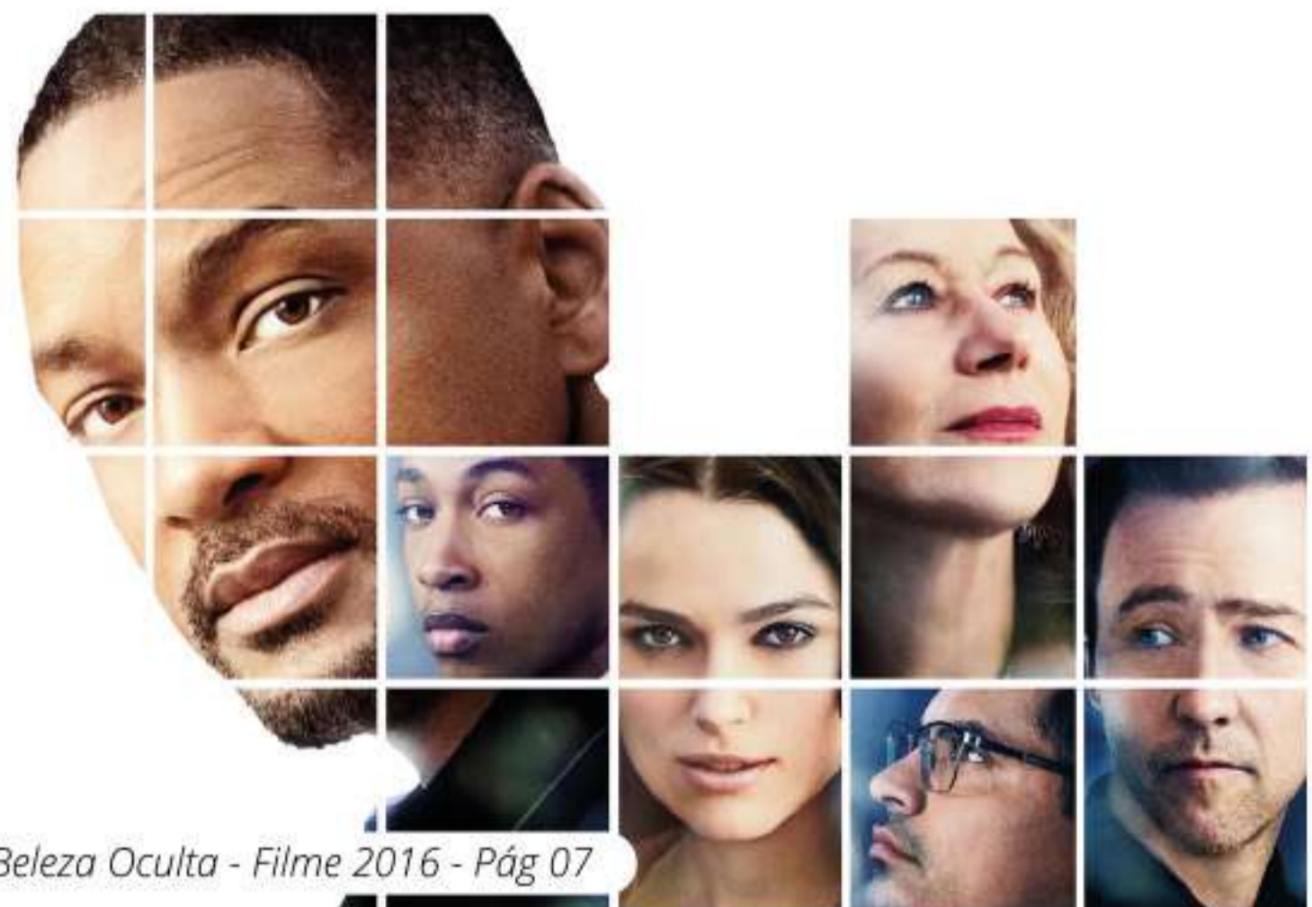
Beleza Oculta - Filme 2016 - Pág 07

Que tal assistir a um filme no fim de semana? Então confira as nossas dicas!