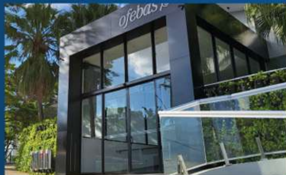
Fachada Ofebas, Unidade Sorocaba

E, ao se tornar um dos nossos associados, você também passa a fazer parte dessa corrente do bem!