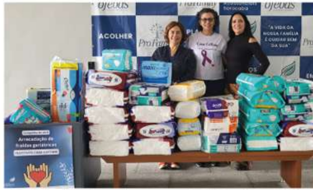
Fraldas direcionadas para o Instituto Casa Cattani

Além do apoio financeiro, a Ofebas realizou diversas campanhas internas com os colaboradores, como arrecadação de agasalhos, litros de leite, material escolar, fraldas descartáveis, entre outros. As doações foram direcionadas conforme necessidade das instituições. Numa dessas campanhas, por exemplo, foram arrecadadas mais de 800 fraldas geriátri-