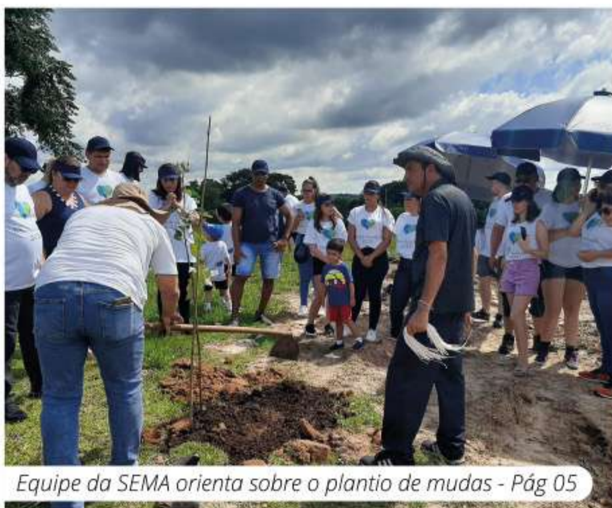
Equipe da SEMA orienta sobre o plantio de mudas - Pág 05

Ofebas e Prefeitura plantam mais de 150 mudas de árvores na zona norte de Sorocaba