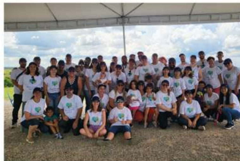
Plantio de Mudas Ofebas 25 fevereiro de 2023

os tutores (bambus para suporte das mudas). Por sua vez, a Ofebas contratou o serviço para fazer os berços para o plantio e forneceu a mão de obra, reunindo colaboradores, familiares e demais interessados. A organização também disponibilizou frutas, água, algodão doce, pipoca e brinquedos infláveis durante o período.