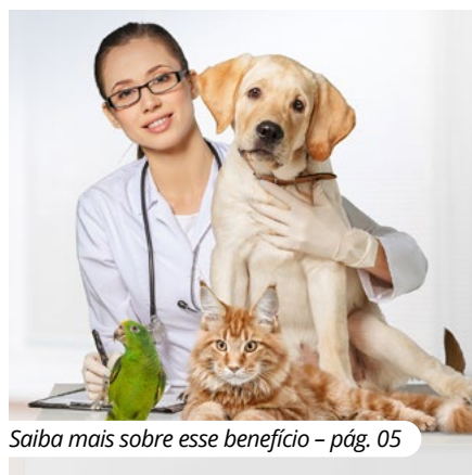
Saiba mais sobre esse benefício – pág. 05

Assistência pet e sem acréscimo no plano mensal é na Ofebas