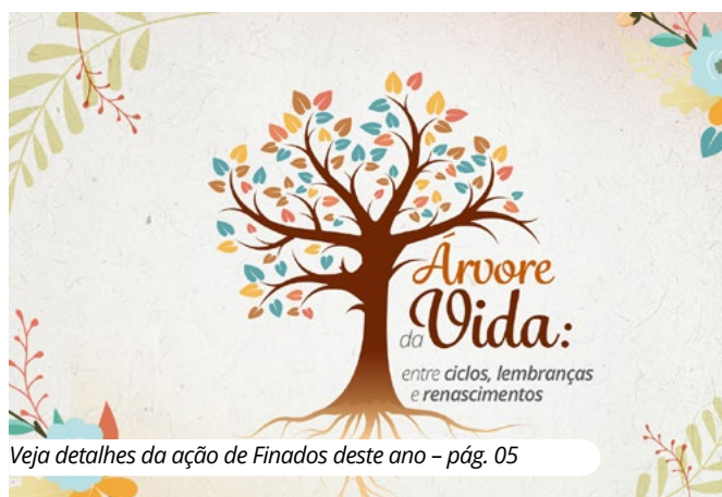
Saiba mais – pág. 04

Assistência pet e sem acréscimo no plano mensal é na Ofebas