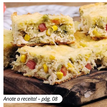
Anote a receita! – pág. 08