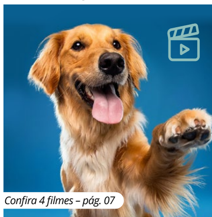
Confira 4 filmes – pág. 07

Os nossos "AUmigões" tomam conta das sugestões de filmes!