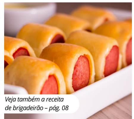
Veja também a receita de brigadeirão - pág. 08

Deu água na boca! Veja como é simples fazer um enroladinho de salsicha