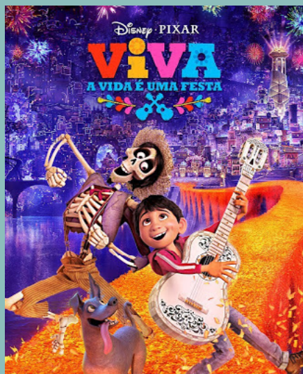
Viva: A vida é uma festa

As dicas desta edição estão bem ecléticas: há sugestão para quem ama enredos com cachorro, mas também para aqueles que gostam de animação da Pixar e para os que preferem histórias com lição de vida. Então já separa a pipoca, reúna a família e aproveite o filme!