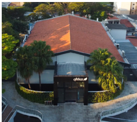
Sede Ofebas Sorocaba.

(projeto de Fanfarra Escolar para pessoas com deficiência intelectual).