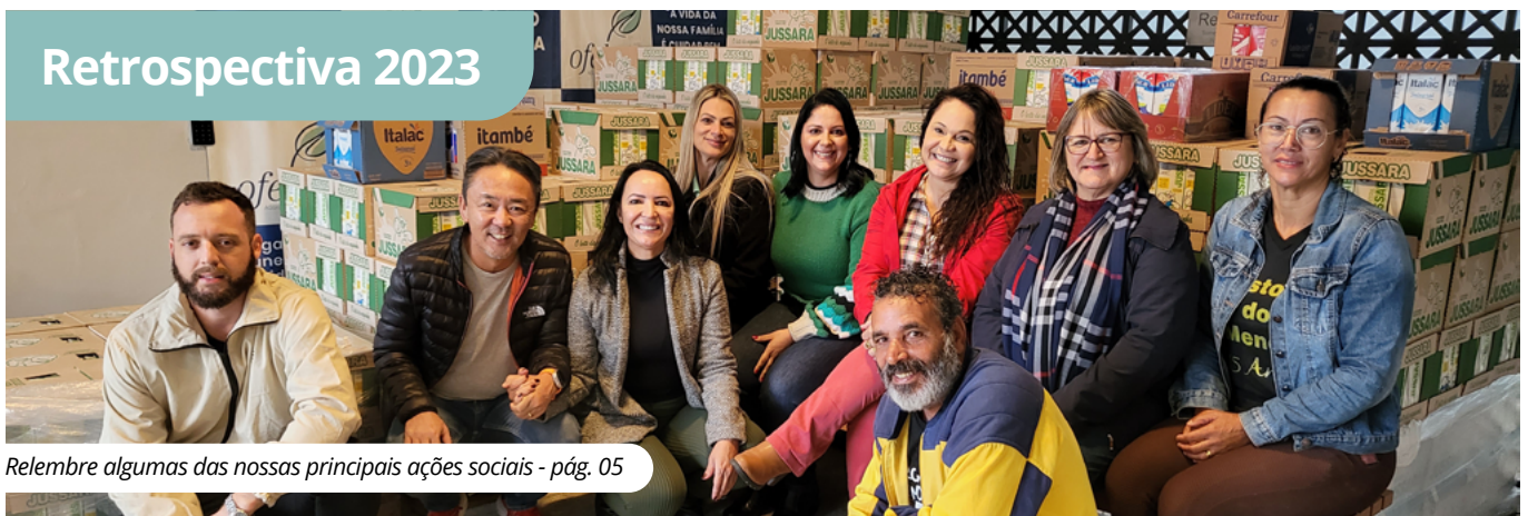
Relembre algumas das nossas principais ações sociais - pág. 05

Ação de Finados de 2023 é marcada por muita emoção e manifestação artística