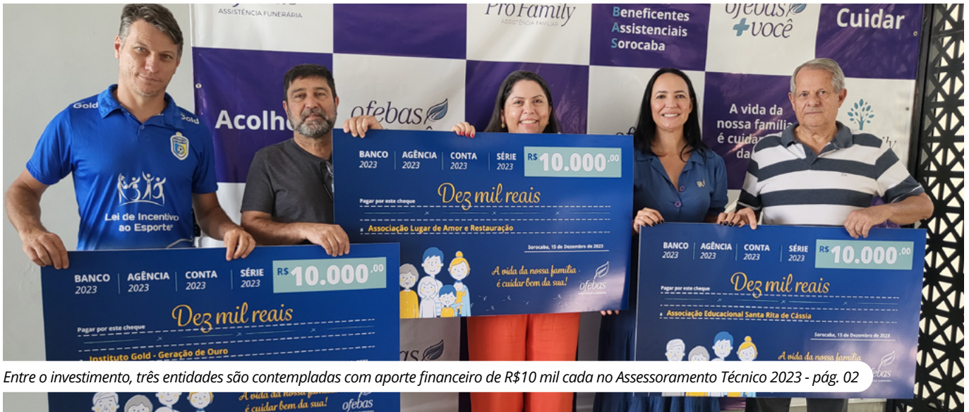
Entre o investimento, três entidades são contempladas com aporte financeiro de R$10 mil cada no Assessoramento Técnico 2023 - pág. 02