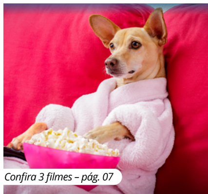
Confira 3 filmes - pág. 07

Sessão cinema! Confira as dicas de filme e já prepara a pipoca