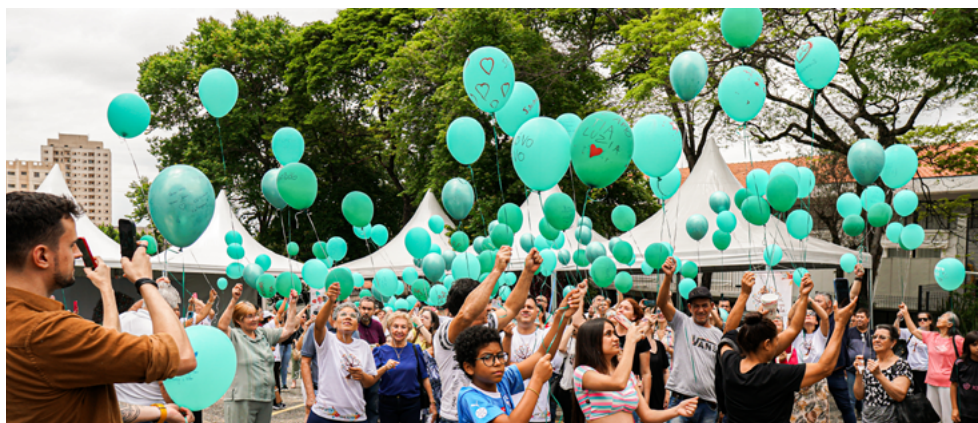
Momento final com a soltura de balões ecológicos. Cada balão carregava uma semente de dente de leão

Cada flor, uma história. Assim pode ser resumida a terceira ação de Finados promovida pela Ofebas. No dia 02 de novembro, a organização preparou uma homenagem aos entes queridos por meio da construção coletiva de uma árvore da vida. A manhã também foi marcada por música ao vivo (acústico com voz, violão e piano), café da manhã, a tradicional soltura de balões ecológicos e muita emoção.