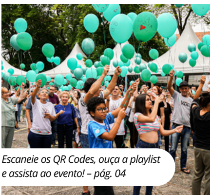
Escaneie os QR Codes, ouça a playlist e assista ao evento! - pág. 04

Ação de Finados de 2023 é marcada por muita emoção e manifestação artística