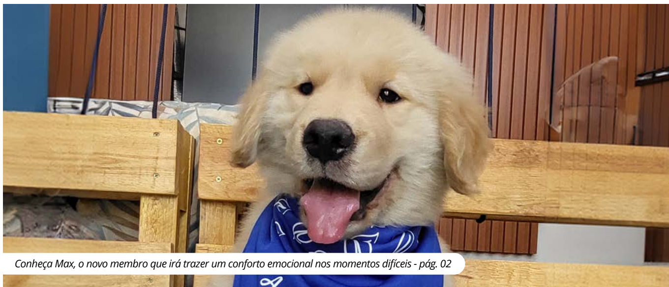
Conheça Max, o novo membro que irá trazer um conforto emocional nos momentos difíceis - pág. 02