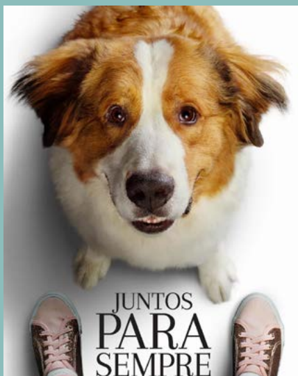
JUNTOS PARA SEMPRE