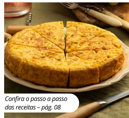
Confira o passo a passo das receitas - pág. 08

Receita doce e salgada? Temos! Veja como fazer uma torta de arroz e um doce de casca de laranja