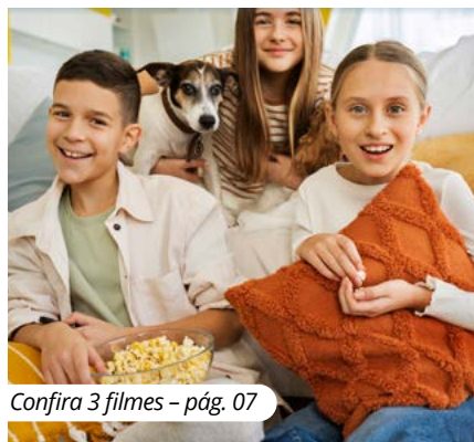
Confira 3 filmes - pág. 07

Sessão cinema! Separa a pipoca e confira as indicações da vez!