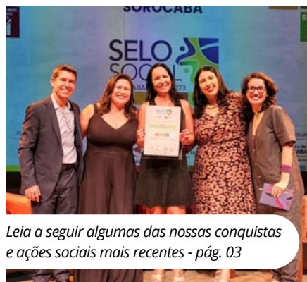
Leia a seguir algumas das nossas conquistas e ações sociais mais recentes - pág. 03

Conquista do Selo Social 2023, doação de material escolar e de tampinhas plásticas