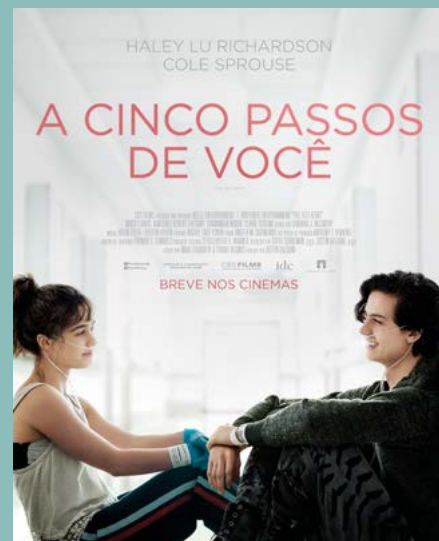
A CINCO PASSOS DE VOCÊ

O enredo conta a vida de Joe Gardner, um professor de banda apaixonado por jazz que sonha em se apresentar em um palco profissional. Quando finalmente consegue sua chance, um acidente o leva a um plano astral chamado "O Grande Antes". Lá, almas são preparadas antes de serem enviadas para a Terra. Joe precisa encontrar uma maneira de voltar ao seu corpo e realizar seu sonho. Para isso, ele se junta a 22, uma alma cínica que não acredita na vida na Terra. Juntos, eles embarcam em uma jornada que os leva a questionar o significado da vida, da felicidade e do que realmente importa.